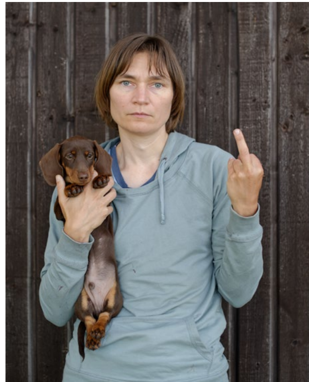
Eine Ausstellung des Louisiana Museum of Modern Art, Humlebæk, Dänemark in Zusammenarbeit mit der Kunsthalle Mannheim. An exhibition of the Louisiana Museum of Modern Art, Humlebæk, Denmark in cooperation with Kunsthalle Mannheim.

Ob liebevoll oder distanziert, nah oder fern, lebendig oder tot – sie bleibt immer Ursprung und Beginn des menschlichen Lebens: die Mutter. Kaum ein Begriff, provoziert vielfältigere Assoziationen, Empfindungen und Rollenklischees. Das internationale Ausstellungsprojekt MUTTER! zeigt, wie unterschiedliche Wahrnehmungen von Mutterschaft in der Kunst gespiegelt werden.